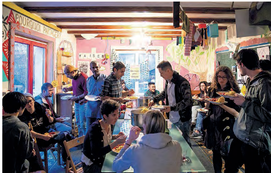
Mittwochs und sonntags wird im La Red gemeinsam gegessen.

Etwa dreissig Leute sind an diesem Mittwoch zum Abendessen gekommen. Darunter ist auch eine Gruppe aus einem Kinderheim. Die Essenden sitzen auf Sofas, Stühlen, Treppen – bei jedem Gang zum Buffet stossen Knie aneinander. Von Linsensuppe, Reis und Gemüseauflauf gibt es reichlich. Umkämpft sind bloss